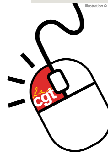
Illustration © Adobe stock - Ratoca

UN CLIC POUR LA CGT , C'EST UNE CLAQUE POUR LA DG!